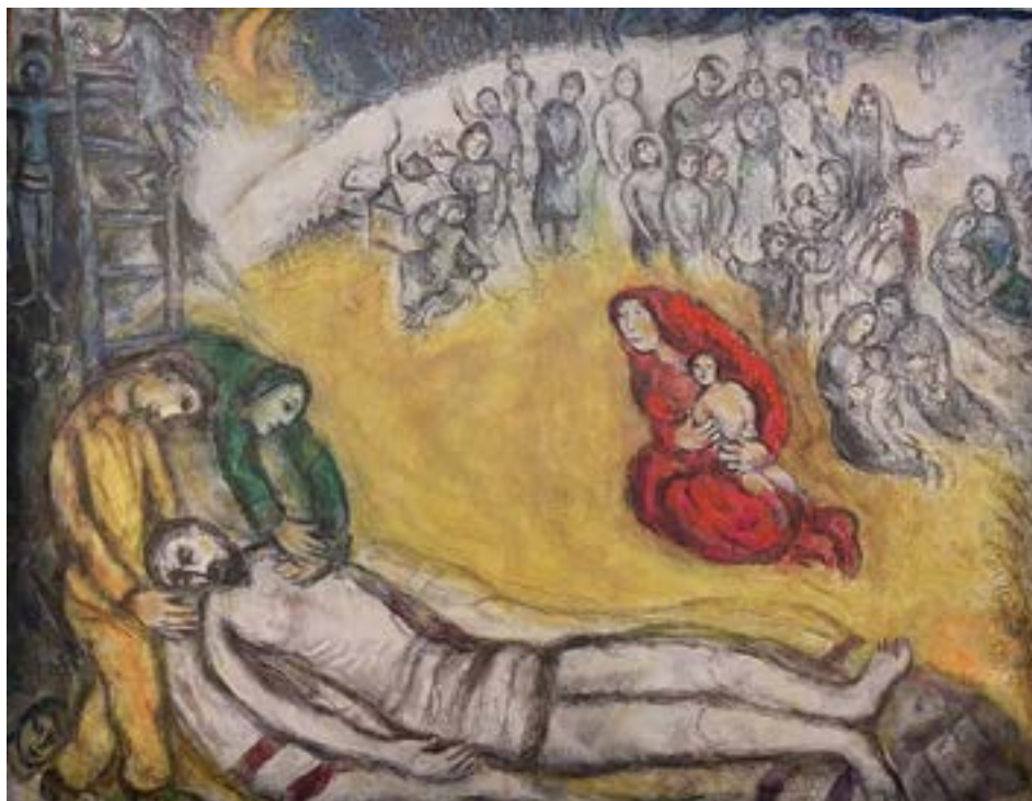
La Discesa dalla Croce, 1976, di Marc Chagall

l'insegnamento esoterico del Cristo, avvicinandosi alle pratiche delle sacerdotesse druide e e che abbia trascorso gli ultimi anni in una grotta in Provenza, (Sainte Baume, la Grotta Santa), fino alla sua morte.