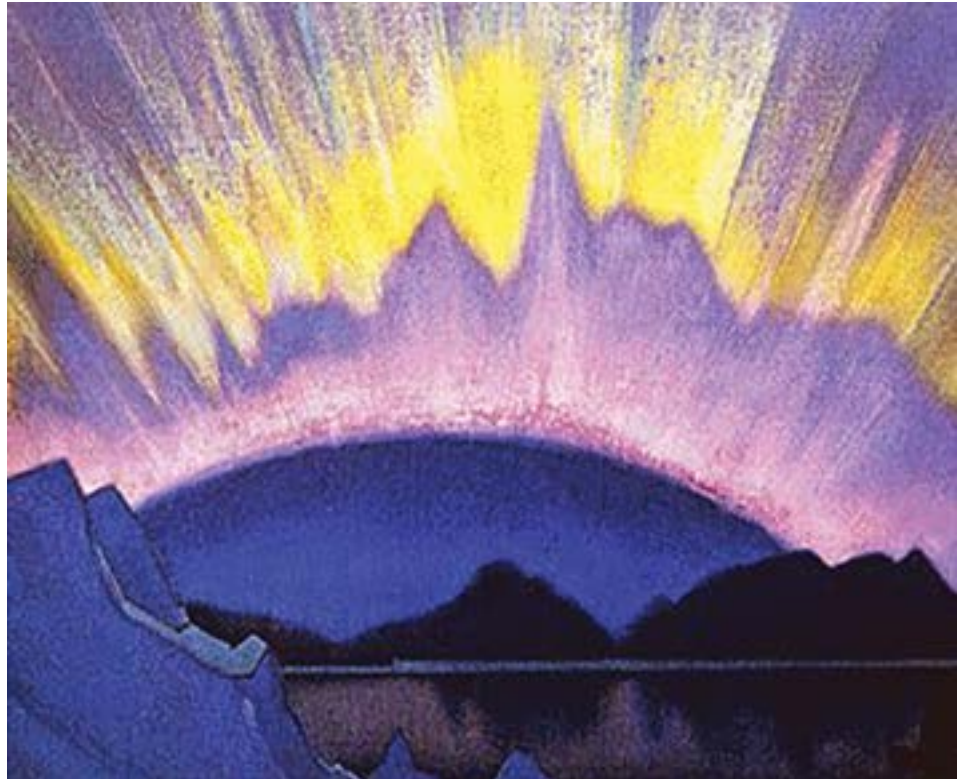
A mezzanotte. Luce di Shambhala, 1940, di Nicholas Roerich

L' Anima Mundi , in quanto incarnazione cosmica di trasformazione e sintesi, funge da luce guida per ispirare la crescita spirituale ed evocare unità e sintesi sia nel macrocosmo che nel microcosmo. Riconoscendo l'energia trasformativa dell'Anima del Mondo, gli individui possono essere ispirati a purificarsi e intraprendere il viaggio spirituale al servizio dell'umanità. All'interno del macrocosmo, l'Anima del Mondo serve a unificare e sintetizzare, collegando tutti gli elementi del sistema solare, inclusi i pianeti, le stelle e le forze cosmiche in un Uno armonioso. Attraverso l' Anima Mundi , tutti i corpi spaziali servono uno scopo più grande. Attraverso la sintesi tras-