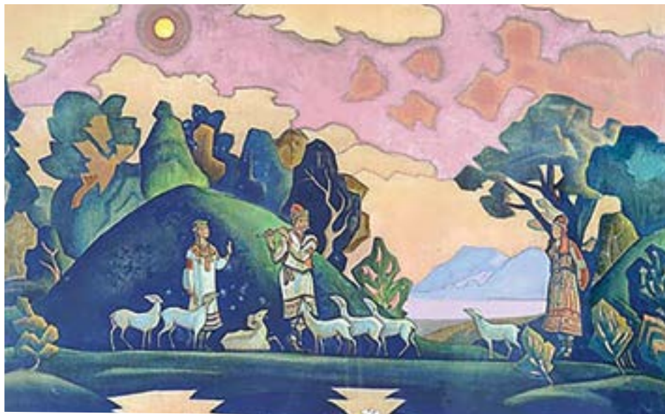
Krishna-Lel , 1932, di Nicholas Roerich

Considerando la grande importanza del fattore energia psichica nella cura delle malattie, la medicina dell'Agni Yoga consiglia l'uso di piante e altri prodotti del