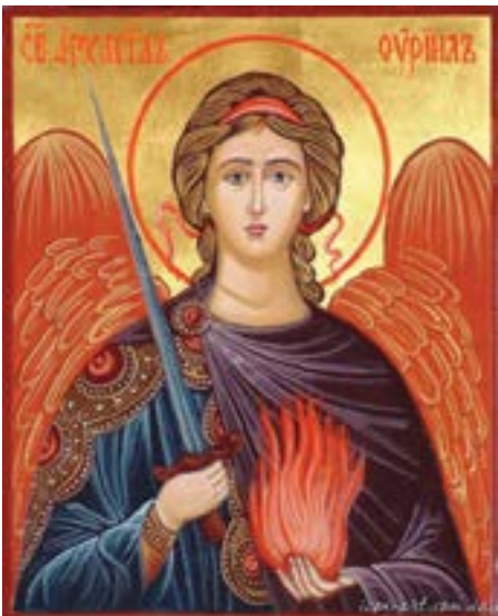
Icona di Uriele

Se non vi fossero stati codesti sublimi spiriti, che diedero impulso alla genesi del pensiero all'alba della nostra umanità fisica sulla Terra, e continuarono a promuovere l'evoluzione della coscienza nel corso di questo difficilissimo e lunghissimo processo, l'umanità non sarebbe ancora uscita dalle condizioni degli abitanti delle caverne. I Grandi Arcangeli sono proprio quei sette Kumara, che sono venuti dai lontani Mondi Superiori compiendo il