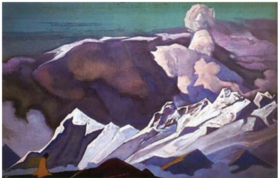
Kalki Avatar , 1935, di Nicholas Roerich

lo stesso lavoro.” 1 A livello individuale, anche i microcosmi all'interno del sistema solare subiscono i propri processi di trasformazione. Mentre il Logos si evolve, gli esseri individuali avanzano nei loro sentieri evolutivi. Le anime si incarnano in forme e regni diversi, sperimentano varie vite, accumulano conoscenza e crescono spiritualmente, “progredendo da uno stato di relativa perfezione a un altro.” 2 Questo processo di reincarnazione e di esperienze successive porta alla trasformazione e all'evoluzione delle anime individuali. Attraverso la meditazione, l'auto-osservazione e il controllo dei propri pensieri, emozioni, parole e azioni, si costruiscono le basi per allinearsi con