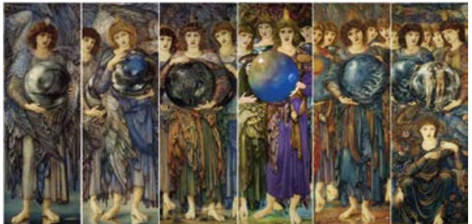
I giorni della creazione , 1870–1876, di Edward Burne-Jones