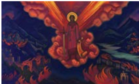
L'ultimo angelo , 1942, di Nicholas Roerich

2. I suoi attributi sono: Fiamma, Spada di Fuoco, libro o rotolo che rappresenta la Conoscenza o Saggezza.